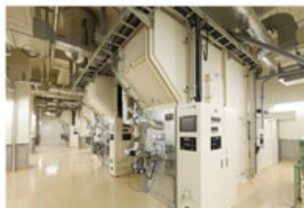
炉室 高性能集塵機や再燃焼炉を備え、環境に配慮した最新の火葬炉にて火葬を行います。