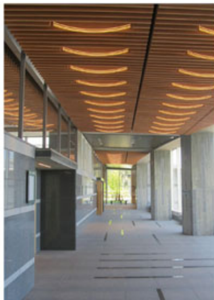
ホール 柔らかな風を吹きながら自然の光が差し込む明るく優しい空間が皆様をお迎えします。