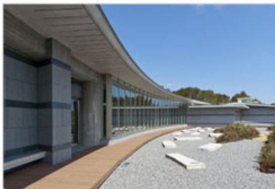
ホール南庭 志摩の海に浮かぶ島々やいかだをモチーフとし、地域の情景を感じられる庭としています。