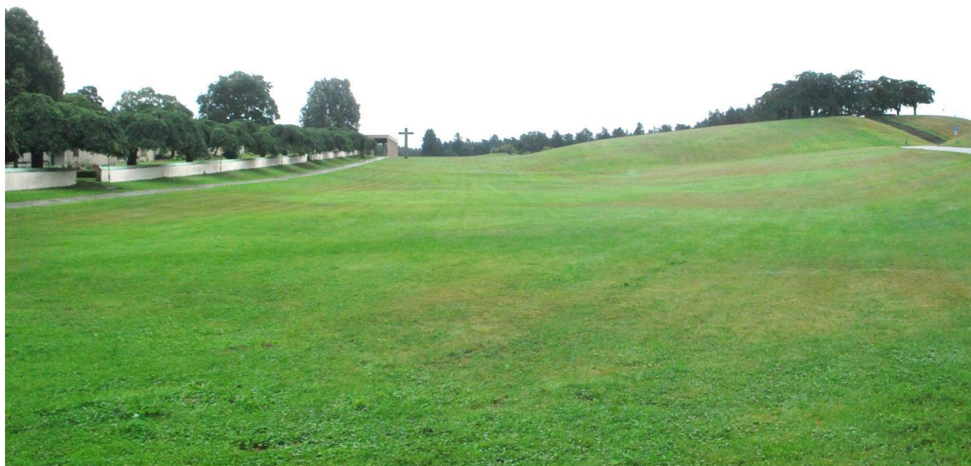
世界遺産となっている火葬場（スウェーデン・ストックホルム市 森の火葬場、森の墓地）